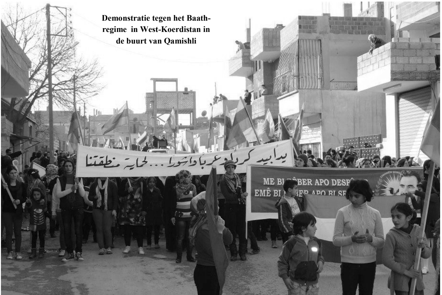
Demonstratie tegen het Baath-regime in West-Koerdistan in de buurt van Qamishli

gerrechten, en als zodanig is het nog steeds verbonden aan het idee van de staat, maar de concepten van democratische autonomie en democratische confederalisme zijn verbonden met wat we kunnen zien als autonome capaciteiten van mensen, een meer directe, en minder vertegenwoordigende vorm van politiek. Democratische autonomie verwijst naar praktijken waarbij mensen in staat zijn hun eigen bestaansvoorwaarden te produceren en reproduceren. Dit wordt aangeduid als 'self-valorisatie' in autonome marxistische literatuur (Cleaver 1992). Democratische confederalisme kan worden gekarakteriseerd als een bottom-up-systeem voor zelfbestuur. En het is hierop waar ik verder op zal ingaan in het vervolg van deze bijdrage.