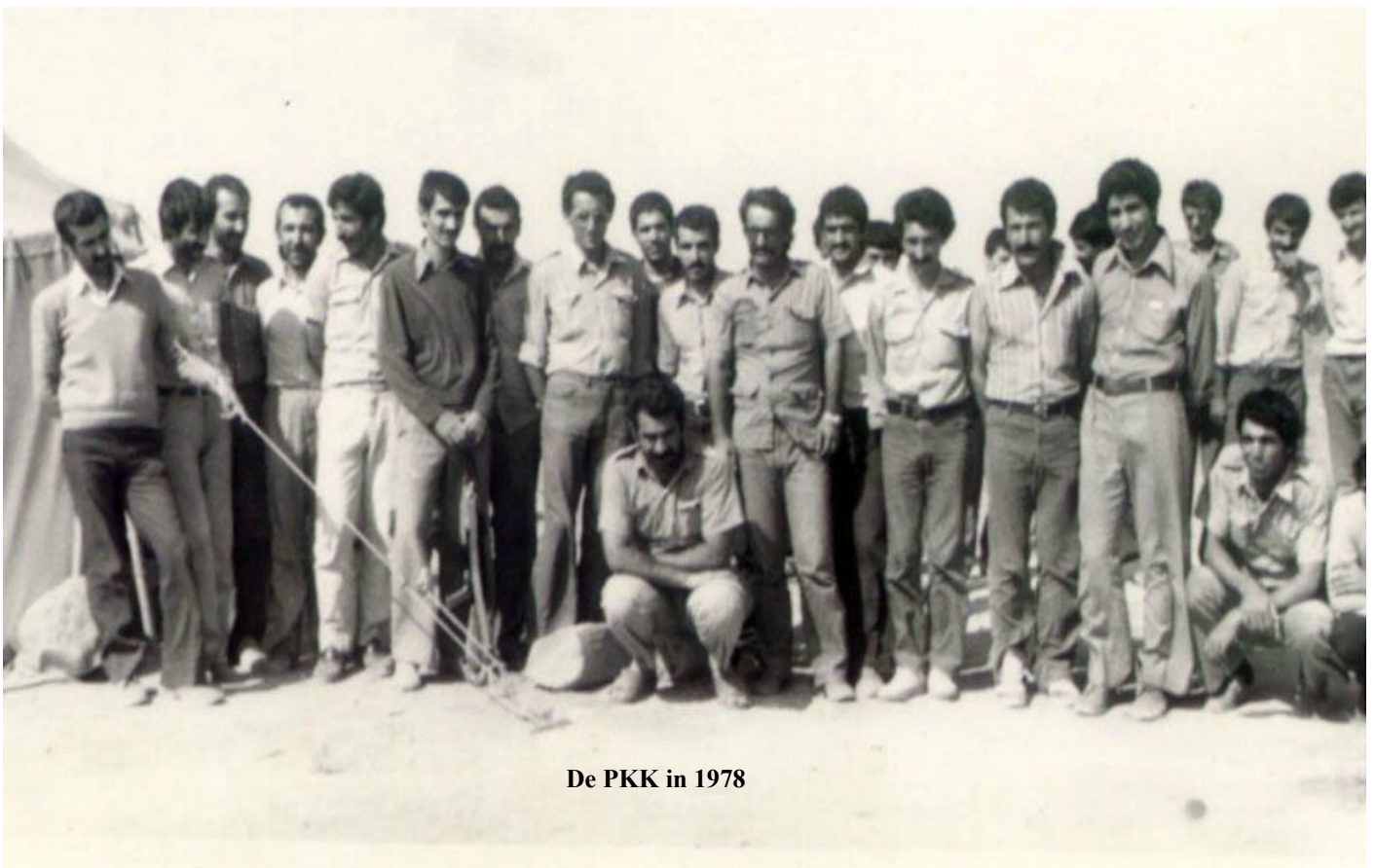
De PKK in 1978