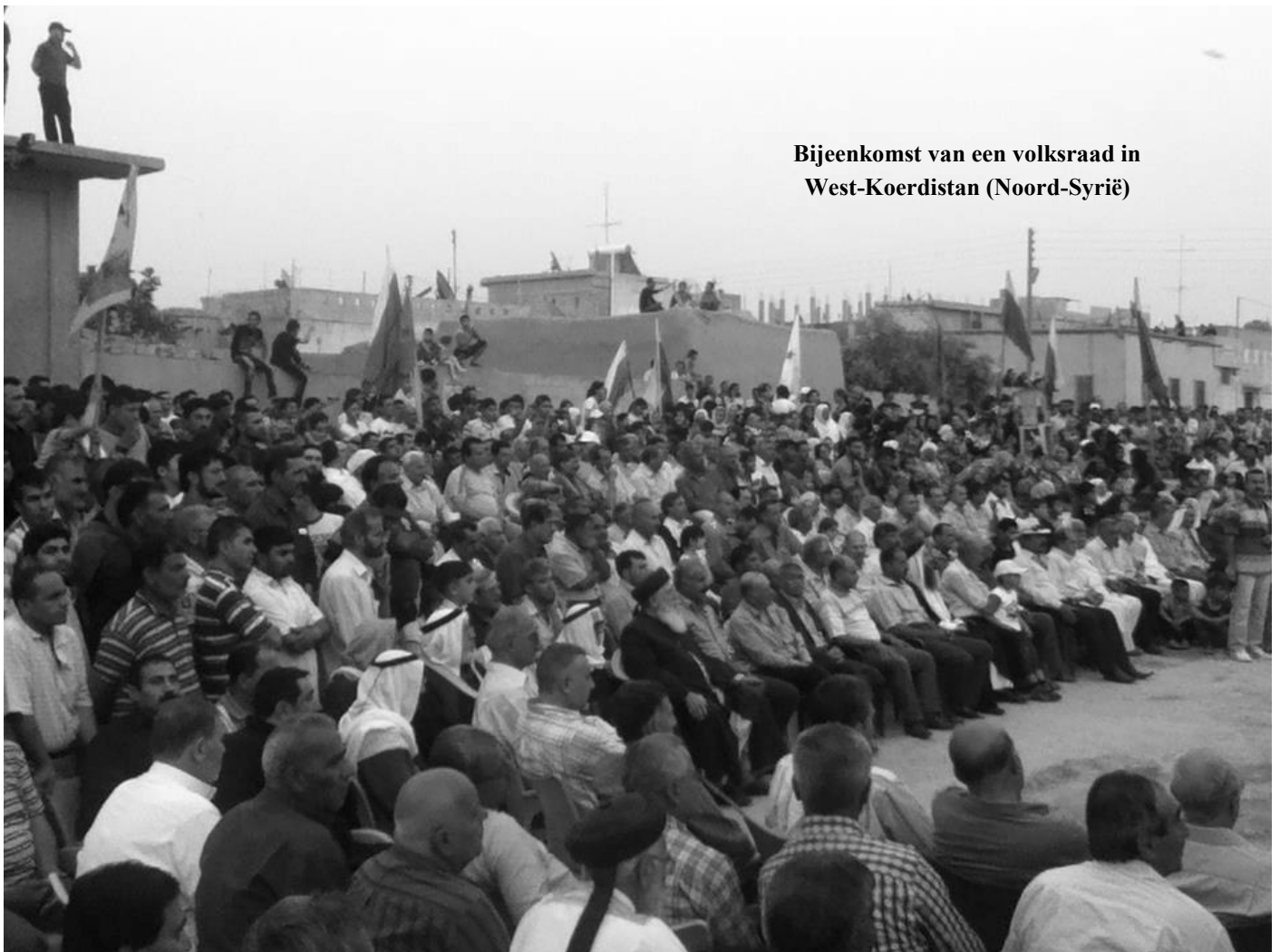
Bijeenkomst van een volksraad in West-Koerdistan (Noord-Syrië)

niet zijn gegeven om onze gedachten te verbergen”. Voor Candar betekent dit dat we niet in verholde termen moeten spreken over de Koerdische kwestie, maar het de Koerdische kwestie noemen. Hij laat ook zien hoe de Turkse premier Tayyip Erdogan, na een aanvankelijke opening, de woorden weer begon te gebruiken om te verhullen: de Koerdische Opening (4) werd het project voor Broederschap en Nationale Eenheid, de belofte op een burgerrechtenproject omgevoerd tot een nationalistisch project, en hoop